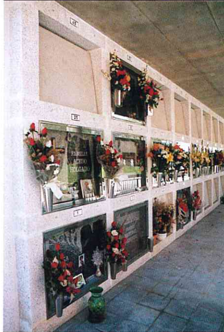
Nou model de nínxols

Durant tot aquest any, Funerària ha continuat introduint noves millores en el Cementiri Municipal de Terrassa.