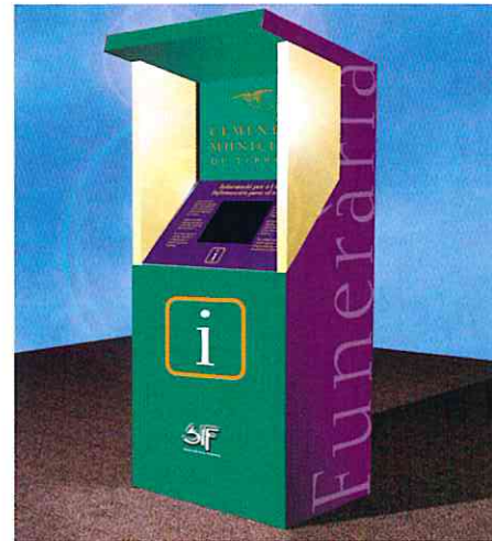
Terminal del SIF

Funerària aprovechará Todos los Santos para presentar a la ciudadanía el SIF.