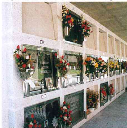
Nuevo modelo de nichos

Durante todo este año Funerària ha continuado introduciendo nuevas mejoras en el Cementerio Municipal.