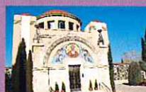
Temple Multiconfessional 4t concert, 12.30 h

Per tal de retre homenatge a tots els difunts de Terrassa, s'ha organitzat un circuit musical per al dia de Tots Sants. Les actuacions aniran a càrrec de la formació Massa Coral de Terrassa , una entitat cultural històrica a la nostra ciutat, Medalla d'Or de la Ciutat de Terrassa, i guanyadora de diversos premis nacionals, que interpretarà diferents obres clàssiques en homenatge als nostres difunts. Les actuacions tindran lloc entre les 11 del matí i les 13 h del migdia, en un recorregut musical que contempla actuacions en 5 punts representatius del Cementiri Municipal de Terrassa (veure plànol).