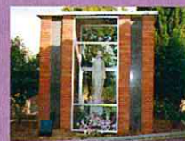
Monument a la Riuada 2n concert, 11.30 h