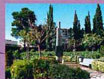
Pl. de Tots Sants 1r concert, 11 h