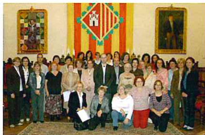
Els alumnes diplomats, al Saló de Sessions de l'Ajuntament de Terrassa.

ment a professionals del món sanitari, social o assistencial, interessats en rebre formació sobre els processos de dol, per tal de poder oferir acompanyament professional a tercers, així com a famílies que han tingut una defunció propera.