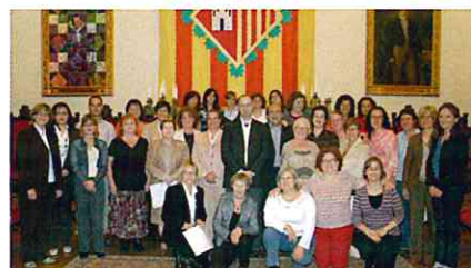
Los alumnos diplomados, en el Salón de Sesiones del Ayuntamiento de Terrassa.

Los cursos de Acompañamiento en el Duelo son una iniciativa de Funerària, y se dirigen principalmente a profesionales del mundo sanitario, social o asistencial, interesados en recibir formación sobre los procesos de duelo, para ofrecer acompañamiento profesional a terceros, así como a familias que han tenido una defunción cercana.