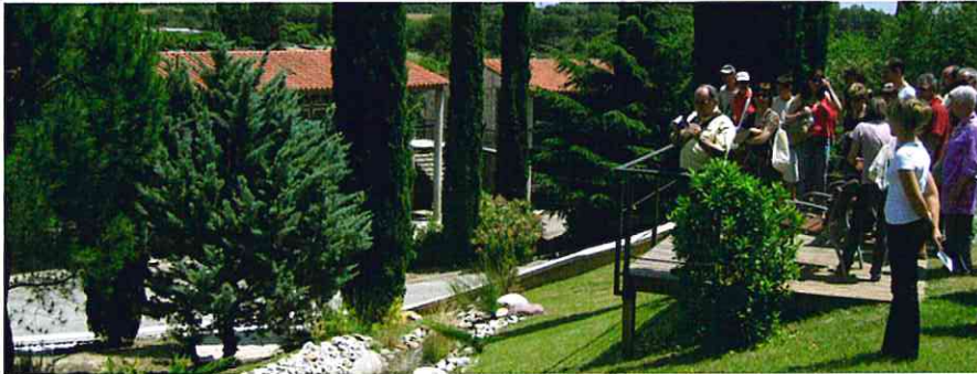
Instantània d'un grup durant una de les visites guiades pel Cementiri.

Terrassa acaba d'incorporar-se a la Ruta Europea de Cementiris, una xarxa que aglutina 26 ciutats europees, entre les que es troben grans capitals com Barcelona, Berlín, Granada, Londres, París, Roma, San Sebastian o Viena.