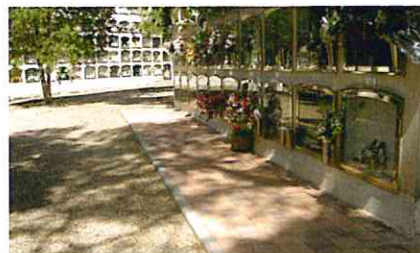
Noves voreres més accessibles.

Funerària no deixa de millorar dia a dia els espais comuns del Cementiri Municipal de Terrassa. Darrerament s'han rehabilitat els laterals dels blocs de nínxols més antics, en els quals s'han realitzat tasques d'arrebossat i pintura. Per altra banda també s'han iniciat les tasques d'adequació de voreres en determinades zones del Cementiri, per tal de millorar l'accessibilitat de les persones amb mobilitat reduïda.