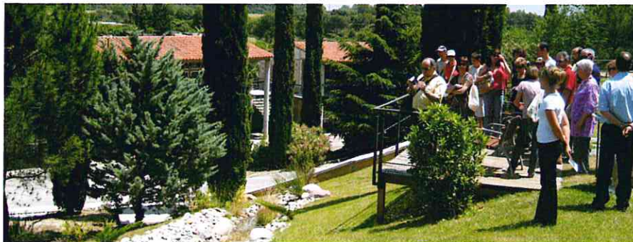
Instantánea de un grupo durante una de las visitas guiadas en el Cementerio.

Terrassa acaba de incorporarse a la Ruta Europea de Cementerios, una red que reúne 26 ciudades europeas, entre las que se encuentran grandes capitales como Barcelona, Berlín, Granada, Londres, París, Roma, San Sebastián o Viena.