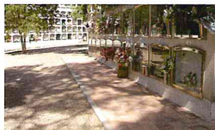
Nuevas aceras más accesibles.

Funerària no deja de mejorar día a día los espacios comunes del Cementerio Municipal de Terrassa. Últimamente se han rehabilitado los laterales de los bloques de nichos más antiguos, en los cuales se han realizado tareas de rebozado y pintura. Por otro lado, también se han iniciado las tareas de adecuación de aceras en determinadas zonas del Cementerio, para mejorar la accesibilidad de las personas con movilidad reducida.