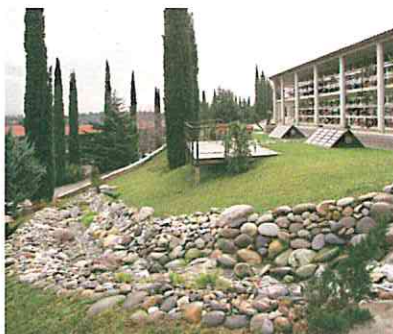
▲ Jardí del Repòs

◆ En una zona natural de 2.000 m 2 ; "El Jardí del Repòs" ofereix dues possibilitats en plena comunicació amb la natura: lliurar les cendres al vent, o enterrar les cendres enmig de la vegetació, en urnes ecològiques que es dissolen amb la humitat.