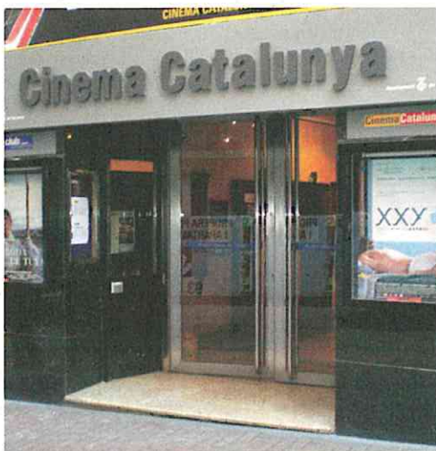
Cinema Catalunya de Terrassa C. Sant Pere, 9

Les entrades es poden recollir al mateix Cinema Catalunya durant la setmana anterior a cada pel·lícula, de dimecres a diumenge, de les 18 a les 24h, i es lliuraran un màxim de dues entrades per persona.