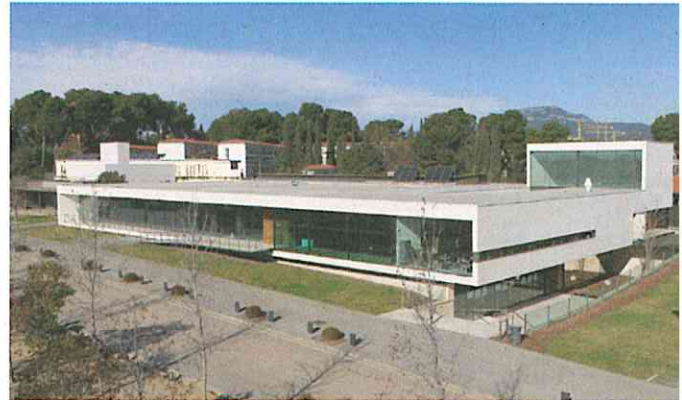
Imatge del Tanatori Municipal de Terrassa.

L'edifici aconsegueix facilitar els desplaçaments interiors amb 10 sales de vetlla en una mateixa planta, i un pati interior permet l'entrada de llum natural en totes elles. L'equipament s'integra en un entorn natural privilegiat, i aprofita la seva potencialitat amb elements d'eficiència energètica molt innovadors, referent estatal del sector.