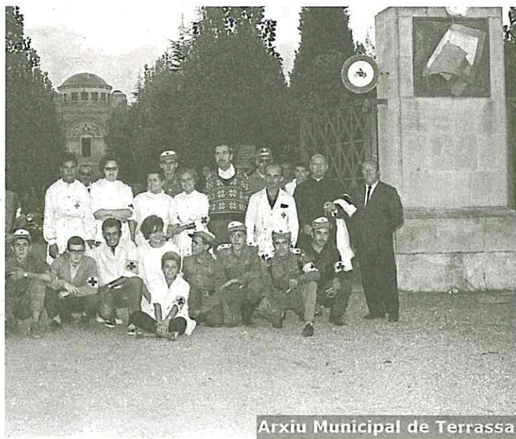
Arxiu Municipal de Terrassa

Cementiri Municipal, 1962. Fons i autor: Fotos Francino. Reg. 099073