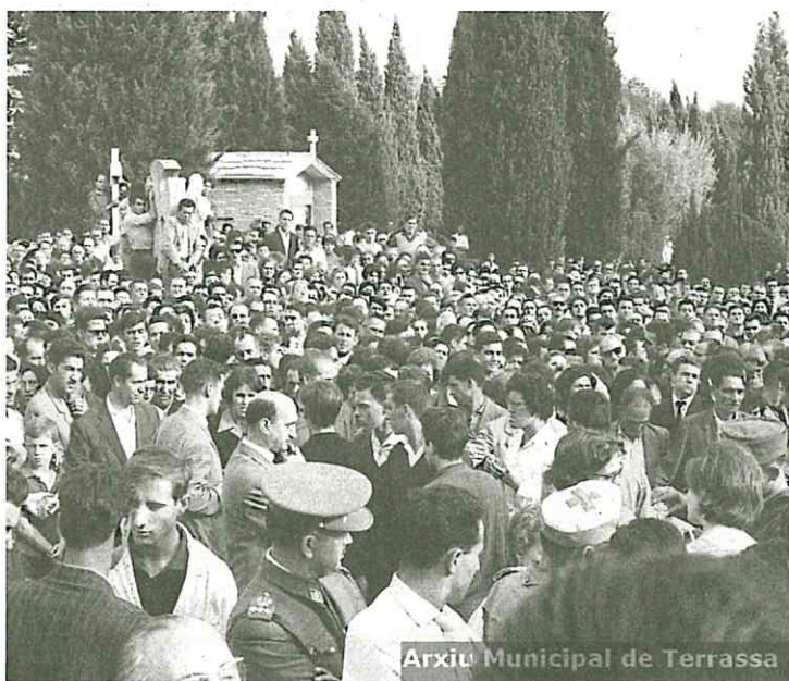
Arxiu Municipal de Terrassa

Al cap d'un parell de setmanes, hi havia qui encara buscava els seus familiars, o volien saber on havien enterrat els seus parents o coneguts, en assabentar-se de la seva mort. A la fossa comunitària on avui hi ha el monument a les víctimes de la riuada, s'hi va enterrar una important quantitat de persones sense poder ser identificades, d'altres no tenien nínxol on poder ser enterrats. Finalment, insisteix en el record que es van viure situacions molt tràgiques, i hi va haver gent que es va quedar sense res. L'ajut entre els ciutadans i ciutadanes de Terrassa va ser clau per poder afrontar aquella situació tan difícil.