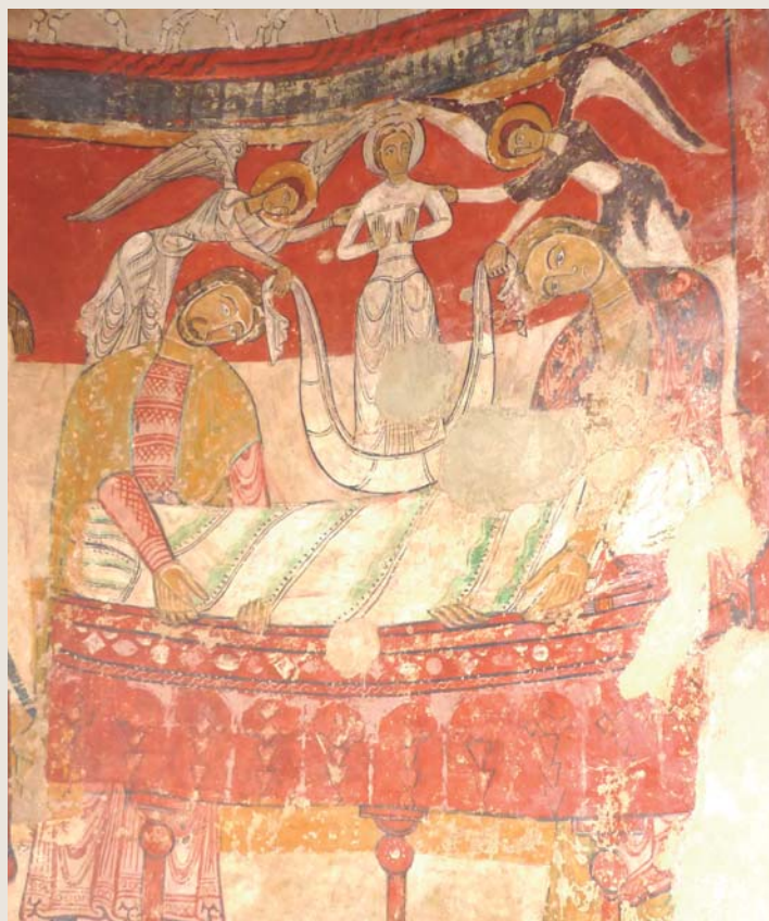
Guió i producció de l'exposició: Museu de Terrassa

L'exposició "L'arqueologia de la mort a Terrassa" fa un recorregut, des de la prehistòria fins a l'actualitat, dels costums i ritus funeraris dels habitants del territori que ocupa actualment la ciutat de Terrassa. Dibuixos, recreacions, fotografies i altres elements museogràfics i explicatius ens conviden a entendre una mica més la mort i la vida dels nostres avantpassats d'una manera didàctica i amena. Aconsellem a tothom que vingui a gaudir de la mostra, que estarà situada a l'entrada del Cementiri del 18 d'octubre al 3 de novembre.